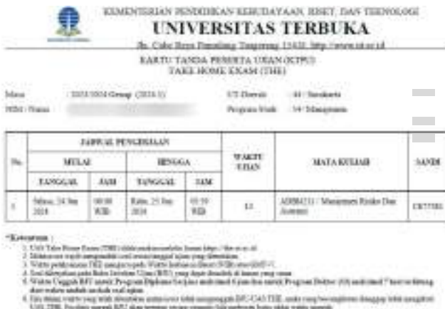
Gambar 6.3 Contoh KTPUG THE