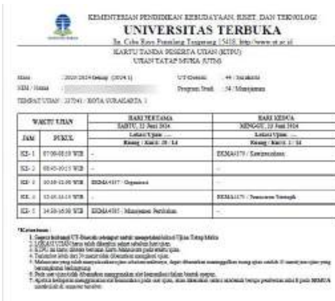
Gambar 6.1 Contoh KTPU UTM

Mahasiswa dapat mencetak KTPU sendiri melalui laman https://myut.ut.ac.id/ . Mahasiswa harus memeriksa kesesuaian kode mata kuliah di KTPU dengan LIP-R, bila tidak sesuai segera melapor ke UT Daerah setempat.