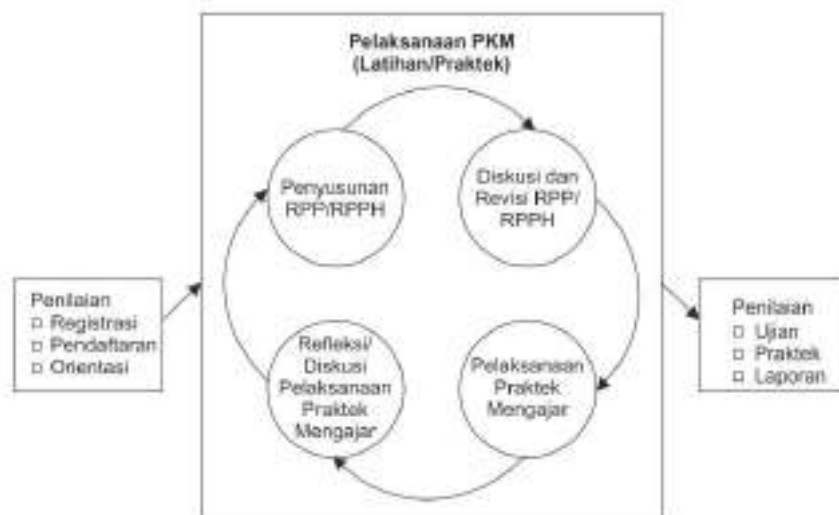
Gambar 5.3 Bagan Alur Kegiatan PKM Pola Berlapis Berulang

Penjelasan yang lebih rinci tentang PKM dan jumlah RPP/RPPH yang harus disusun dapat dilihat dan dipelajari pada buku Panduan PKM Program Studi S-1 PGSD atau S-1 PGPAUD atau Panduan PKM PGSM, FKIP-Universitas Terbuka.