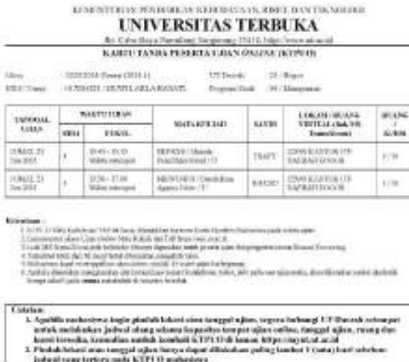
Gambar 6.2 Contoh KTPUG